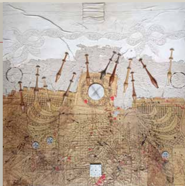
Zapis nekega časa, mešana tehnika na platno, 80 cm x 80 cm A Record of a Certain Time, mixed media on canvas, 80 cm x 80 cm

Dogodke bomo fotografirali za namene dokumentiranja, promocije razstave in obveščanja javnosti.