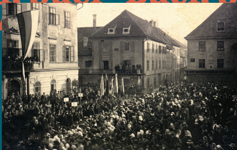
Praznovanje dneva svobode pred Magistratom v Celju 6. 11. 1918, hrani Muzej novejšje zgodovine Celje