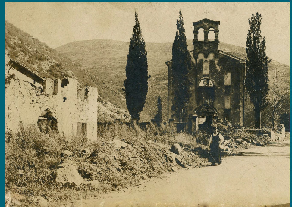
Posledice 1. svetovne vojne, hrani Goriški muzej

Po koncu prve svetovne vojne je zunaj državnih meja novoustanovljene Kraljevine Srbov, Hrvatov in Slovencev ostal znaten del slovenskega narodnega ozemlja, ki je obsegal skoraj tretjino celotnega etničnega prostora. Največ slovenskega prebivalstva je živelo na območju rapalske meje, kjer so se razmere po vojni še posebej zaostriale. Tamkajšnji Slovenci so bili izpostavljeni sistematičnim oblikam narodnega, političnega in kulturnega zatiranja, kar je številne posameznike in družine prisililo k zapuščanju domačega okolja. Čeprav so se nekateri prebivalci zaradi neposredne bližine frontne črte morali umakniti že med vojno, se je množično izseljevanje v pravem pomenu besede začelo šele po vključitvi Primorske v okvir Kraljevine Italije. Tradicionalni protislovanski nacionalizem italijanske države se je kmalu še zaostрил v vzponom fašizma, ki je represijo povzdignil na institucionalno in ideološko raven. V iskanju varnejših življenjskih razmer so se Primorci naseljevali v Ljubljani in Kranju ter na Štajerskem. Tudi na območju Celja so se vključili v lokalno okolje in s svojim delovanjem pomembno sooblikovali gospodarski, upravni, prosvetni, kulturni in družbeni razvoj regije.