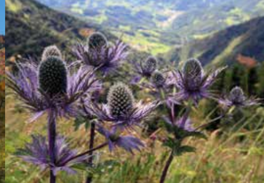
Vrh Porezna je botanično zelo zanimiv, med tamkajšnje endemite spada alpska možina ( Eryngium alpinum ).

ustanovila ilegalni planinski klub Krpelj. Gojiti planinstvo je v takratnih okoliščinah pomenilo ohranjati slovenstvo. Društvo je znova zaživelo po drugi svetovni vojni. Na ustanovnem občnem zboru leta 1946 so že razpravljali o obnovitvi koče na Poreznu, vendar ne tiste, zgrajene leta 1907. Odločili so se za obnovo nekdanje italijanske vojašnice tik pod vrhom. Veliko truda je bilo potrebnega, da je bil cilj dosežen. Fotografije nosačev, ki proti vrhu nosijo deske, potrebne za obnovo, so dovolj zgovorne. Vse od takrat je skrb za kočo na Poreznu stalnica v delu društva, poleg nje so pred leti skrbeli tudi za kočo na Črnem vrhu in za več planinskih zavetišč. V desetletjih po vojni se je v okviru društva ustanovilo več odsekov (gospodarski, markacijski, mladinski, vodniški, alpinistični, odsek za varstvo gorske narave, turnokolesarski), ki se vsak na svoj način trudijo, da ostajajo naše planinske poti urejene, koča na Poreznu vzdrževana, planinci pa deležni prijaznega sprejema in postrežbe. Ob vsem naštetem pa skrbijo, da se člani društva smelo in varno podajajo v gore ter da se ljubezen do narave in skrb zanjo prenašata na mlajše rodove. Prijatelji Porezna tako še zdaleč niso samo tisti, ki jih je društvena akcija s tem imenom v preteklih nekaj letih spodbudila k pogostejšim obiskom te gore, temveč tudi vsi člani društva, ki jim je domači Porezen posebej pri srcu.