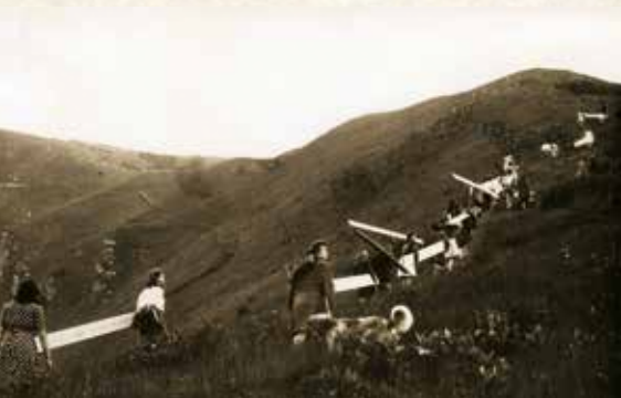
Najodmevnejša akcija cerkljanskih planincev je gotovo zimski pohod na Porezen, ki ga v spomin na tragične dogodke marca 1945 organizirajo že od leta 1976.