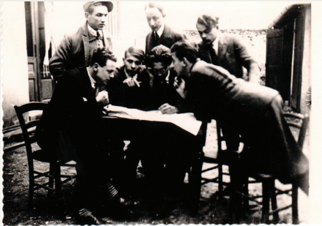
Tigrovci in člani poduredništva Edinosti leta 1928 v Gorici.