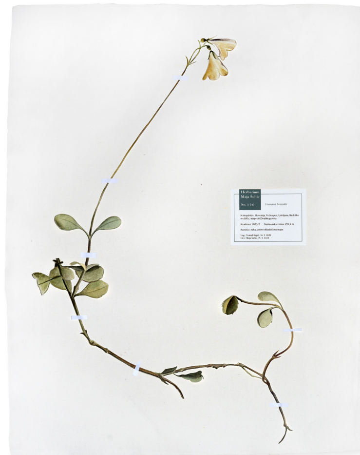
Severna linejka, 76 x 58 cm, posušen in izrezan akvarel, 2022

Severna linejka ( Linnaea borealis L.) je bila najljubša cvetnica velikega švedskega naravoslovca Carla Linneja, začetnika binomske nomenklature vrst, s katerim si je dopisoval Scopolio. Ta nežna rastlina predstavlja ostanek ledenodobnega rastišča in prav v Sloveniji se nahaja njeno najjužnejše rastišče v Evropi. Na Rdečem seznamu je severna linejka uvrščena v najvišjo kategorijo ogroženih vrst Evrope.